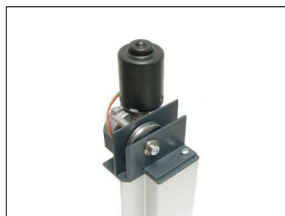
Abb.5 Wartungsfreier Präzisionsmotor