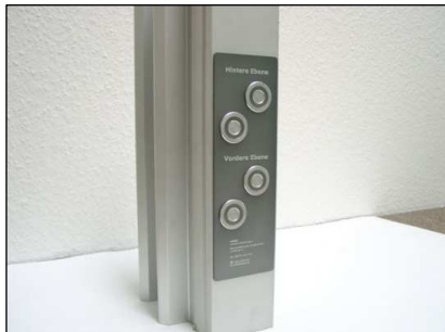
Abb. 1 Piezzo-Berührungsschalter mit Leuchtring

Beim Einsatz vor Digestoren empfiehlt sich aus Sicherheitsgründen der Einbau einer Lichtschranke. Bei Verwendung von neigbaren Projektionsflächen wird eine elektronische Verriegelung erforderlich. Stranggezogene, einteilige Aluminiumpylonen sorgen für elegante Optik und einwandfreien geräuscharmen Lauf Ihrer Tafelanlage. Die Kabelführung erfolgt in Spezial-Aluminiumprofilen (Abb. 4). Wartungsfreie Spezialmotoren (Abb. 5) sorgen für eine präzise Bewegung der Tafel.