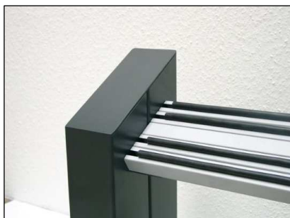
Abb. 3 Drucksensorschaltung