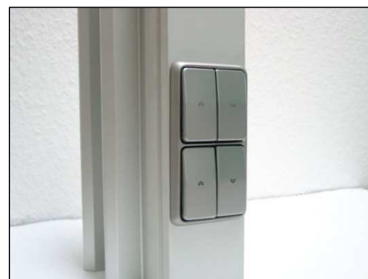
Abb. 4 Aluminiumprofil mit Drucktasterschaltung